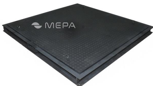
Рис. 3 – Весоизмерительная платформа установлена в монтажную раму. Внешний вид

При установке платформы весов в монтажную раму проверьте наличие равномерного зазора между рамой и платформой по всему периметру (рис.4) и равномерность распределения весов по высоте относительно монтажной рамы (рис.5).