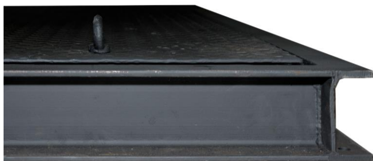
Рис. 5 – Проверка равномерности распределения платформы весов по высоте монтажной рамы после установки