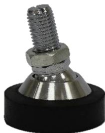
Рис. 7 – Опоры

5. Извлеките пальцы или опоры и упакуйте их до момента монтажа платформы.