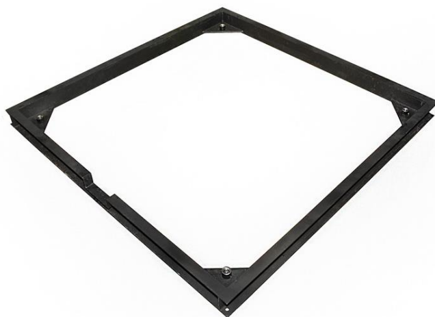
Рис. 1 – Монтажная рама весов ВТП

Для установки весов МЕРА-ВТП в уровень с полом (в приямок) опционально платформы комплектуются заводской монтажной рамой (рис.1) соответствующего размера. Заводская монтажная рама обеспечивает все необходимые условия для правильного монтажа весов в приямок.