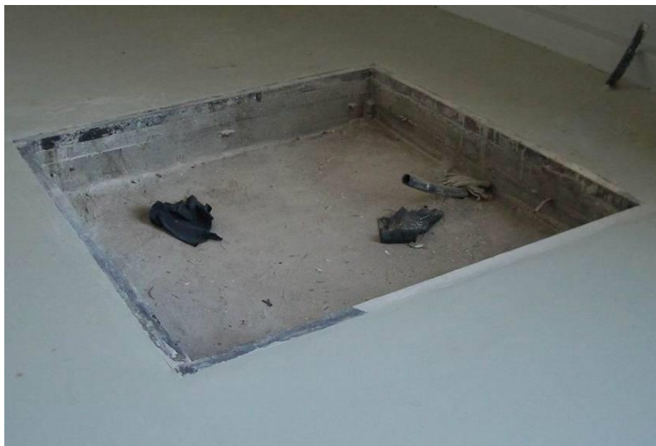
Рис. 9 – Внешний вид приемка для весов МЕРА-ВТП

До установки и заливки бетоном монтажной рамы необходимо провести подготовительные работы в соответствии с разделом Подготовительные работы и обустройство канализации в соответствии с проектной документацией (рис. 9).