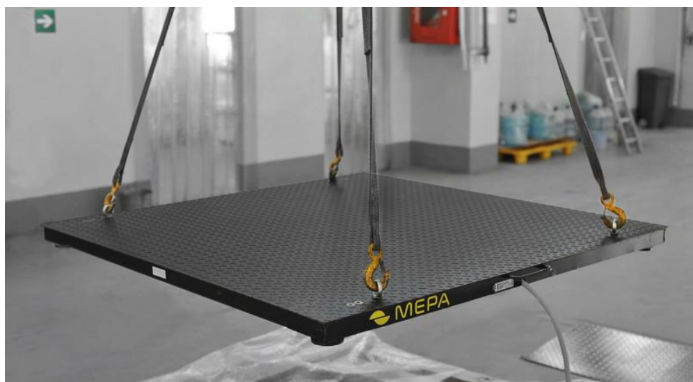
Рис. 6 – Монтаж или извлечение платформы весов.

4. Извлечение весоизмерительной платформы из монтажной рамы. Извлеките платформу из монтажной рамы. Для удобства монтажа платформа оснащена резьбовыми отверстиями для установки рым-болтов (рис. 6). Отверстия находятся в углах и закрыты пластиковыми заглушками.