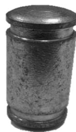
Рис. 8 – Шарнирный палец