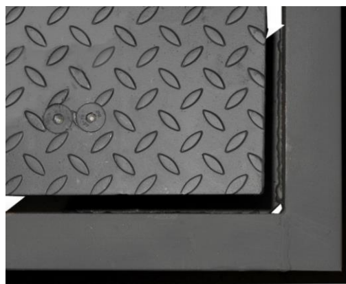
Рис. 4 – Весоизмерительная платформа установлена в монтажную раму. Внешний вид