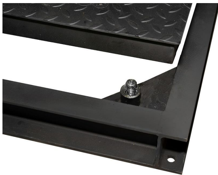
Рис. 11 – Установка весоизмерительной платформы весов, укомплектованных шарнирным пальцем, в монтажную раму

В случае комплектации опорами, важно контролировать их наличие и совпадение стыковки опор с местом их установки на раме.