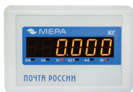
Дублирующий LED-дисплей в комплекте