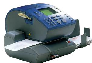
Подключение к франкировальным машинам T-1000 Optimail, Ultimail 45, Ultimail 60, Ultimail 90